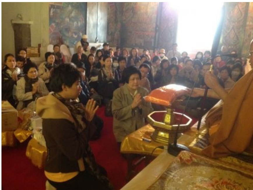
ถวายผ้าป่า พืษุติกา ต้นสงวน เป็นประธาน เป็นวันเกิดของท่านพอดิ

ออกจากโรงแรมนิคโก้ โลตัส แวะไปถวายผ้าป่าที่วัดไทยกุสินาราเฉลิมราชย์