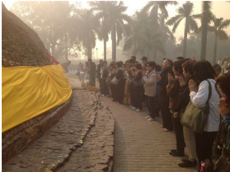
ถวายผ้าห่ม มกุฏพันธเจดีย์ สถานที่ถวายพระเพลิง

แล้วไปเวียนเทียนประทักษิณรอบมกุฏพันธเจดีย์ สถานที่ถวายพระเพลิง พร้อมทั้ง ห่มผ้ารอบพระเจดีย์