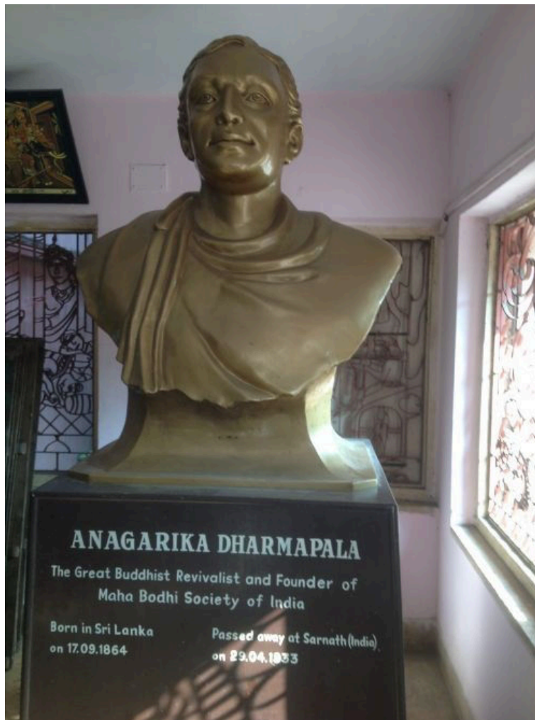
ท่านอนาคาริกธัมมปาละ ชาวศรีลังกา ผู้นำการเรียกร้องพุทธสถานคืนสู่ชาวพุทธ