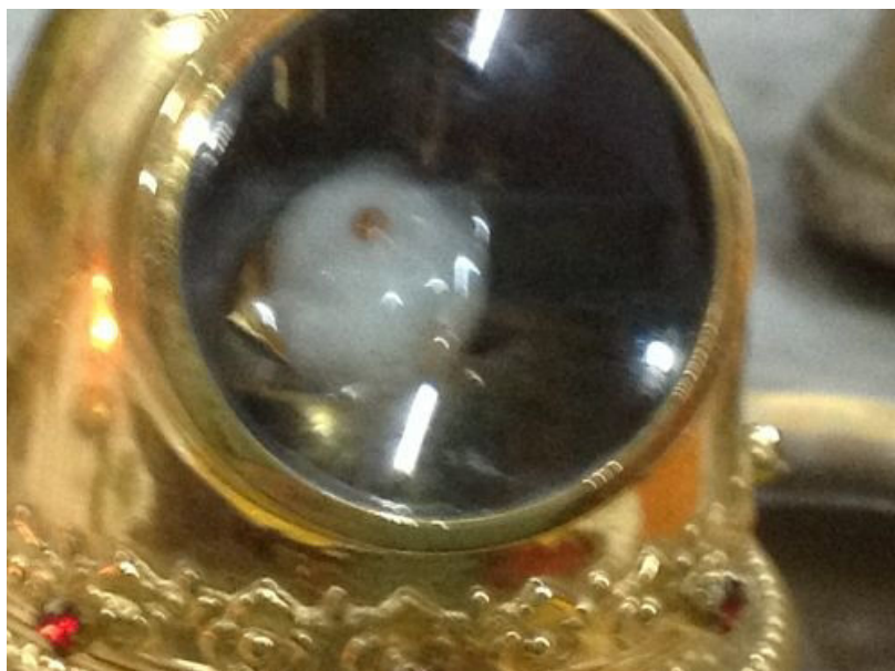
พระบรมสารีริกธาตุสีทอง