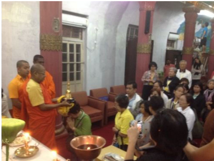
เทินพระบรมสารีริกธาตุ

ผู้มาใหม่ถามว่า ทำไมต้องเทินศีรษะ คำบรรยายของท่านอาจารย์มาตอบว่า พระบรมสารีริกธาตุนี้เป็นส่วนหนึ่งของพระวรกายของพระองค์ ซึ่งเมื่อตรัสรู้เป็นพระอรหันตสัมมาสัมพุทธเจ้าแล้ว ก็ทรงปฏิบัติพุทธกิจทุกวัน วันละ 22 ชั่วโมง ทรงประทับพักผ่อนเพียงวันละ 2 ชั่วโมง ตลอดเวลายาวนานถึง 45 พรรษา เพื่อช่วยสัตว์ที่สั่งสมบาปมาให้พ้นจากทุกข์ในวัฏฏะด้วยพระมหากรุณาที่ยิ่งใหญ่ เหมือนกับได้กราบแทบพระบาททั้งคู่ของพระศาสดา เหมือนยกพระบาททั้งคู่ของพระองค์วางบนศีรษะด้วยความนอบน้อมอย่างสูงสุดในพระคุณอันประเสริฐ