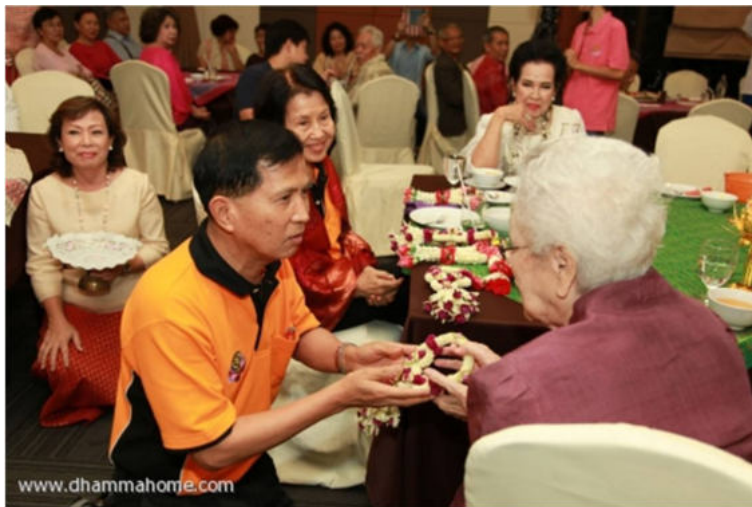
ท่านพลเอกสพรั่ง กัลยาณมิตร มอบมาลัยกราบคุณย่า