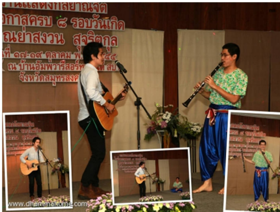
การแสดงดนตรีสากล