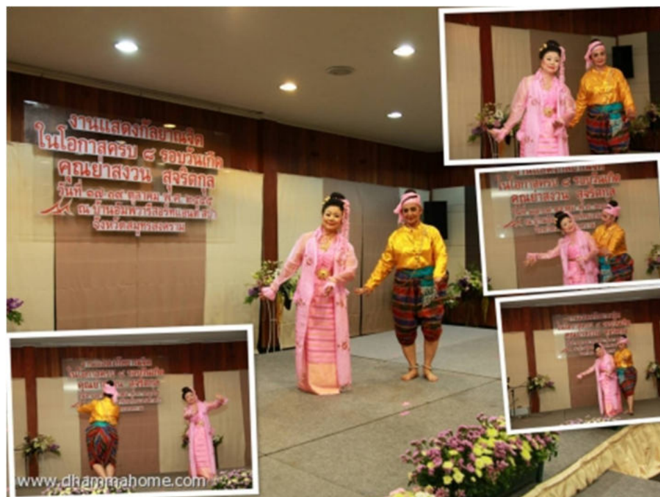
รำลาวดวงเดือน