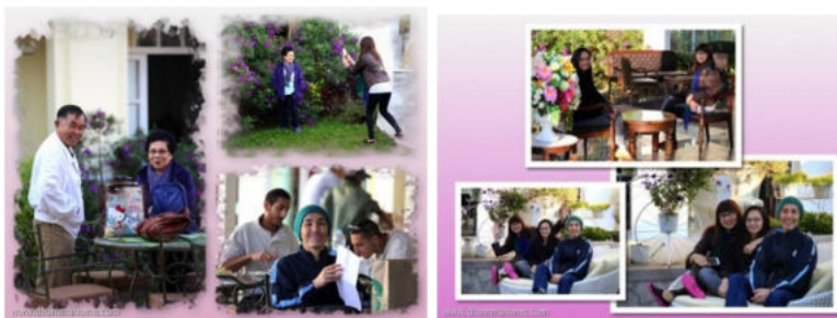
หลังอาหารทุกคนเก็บ กระเป๋าเช็คเอาท์ออก จากโรงแรมเพื่อเดิน ทางไปสนทนาธรรม ณ