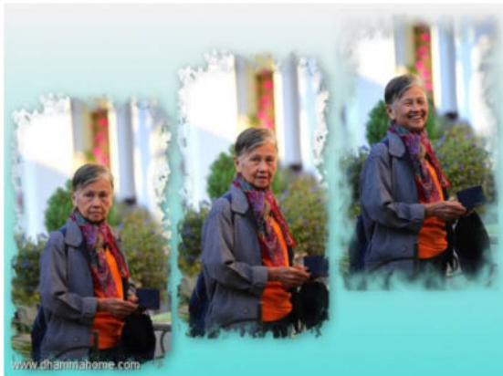
ภาพพี่เดือนฉาย คำอำนวย ผู้จัดทริปสนทนาธรรมในที่ต่าง ๆ ผู้มากด้วยเมตตา