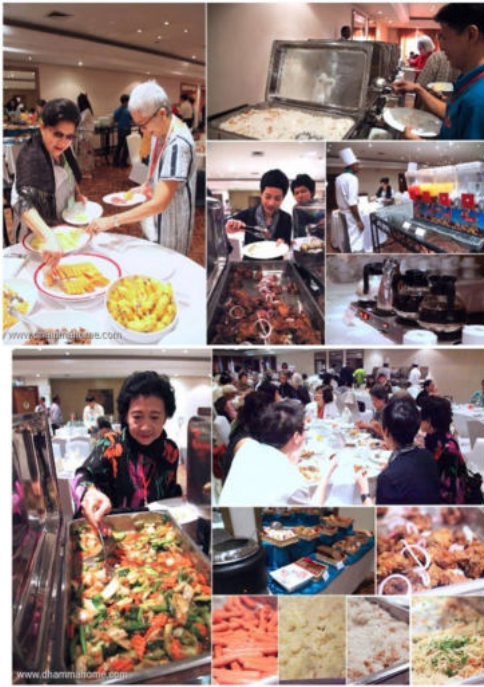
บรรยากาศช่วงรับประทานอาหาร ที่โรงแรม Gateway Airport Garden

หลังจากรับประทานอาหารกลางวัน ที่โรงแรม Cinnamon Lodge เมือง Habarana แล้ว จึงเดินทางไปชมเมืองโปลอนนารูวา อดีตเมืองหลวงของศรีลังกาในช่วงพุทธ ศตวรรษที่ ๑๖-๑๗ (ยุคก่อนสมัยสุโขทัยและ เป็นเมืองต้นแบบของอาณาจักรสุโขทัย ซึ่งมี สถาปัตยกรรมและประติมากรรมที่งดงามไป ด้วยพุทธศิลป์ที่สมบูรณ์ที่สุดแห่งหนึ่งของ ศรีลังกา อาทิ พระพุทธรูปหินแกะสลัก ปาง สมาธิ ปางประทับยืน และปางพุทธไสยาสน์ บนหน้าผาที่กัลวิหาร หลังจากนั้นจึงเดิน ทางเข้าสู่ที่พักและรับประทานอาหารค่ำ ที่ Aliya Resort ซึ่งขณะที่เดินทางถึงเป็นเวลา ค่ำและมีฝนตกปรอย ๆ