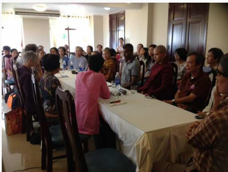
สนทนาธรรมที่ห้องประชุมในโรงแรมกีหว่า ในตอนเช้า

จำมาได้เท่านั้นละ แต่แค่นี้ถ้าได้พิจารณาบ่อยๆ เนืองๆ ก็เป็นประโยชน์มหาศาล (อันนี้บอกตัวเอง)