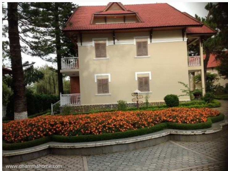
(วิลลาในรีสอร์ท)