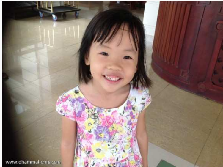
(สาวน้อยมหัศจรรย์)

วันนี้คุณฮว่า สุภาพสตรีชาวเวียงคานามจากซานออยเป็นเจ้าภาพอาหารกลางวัน และผู้จัดชาวเวียงคานามทำเค้กคำขวัญมูลนิธิฯ มาให้ท่านอาจารย์ตัด เป็นของหวาน และยังพาพวกเรานั่งรถตุ้มหิวทักสน์รอบเมืองห้วงเต่า ขออนุโมทนาค่ะ