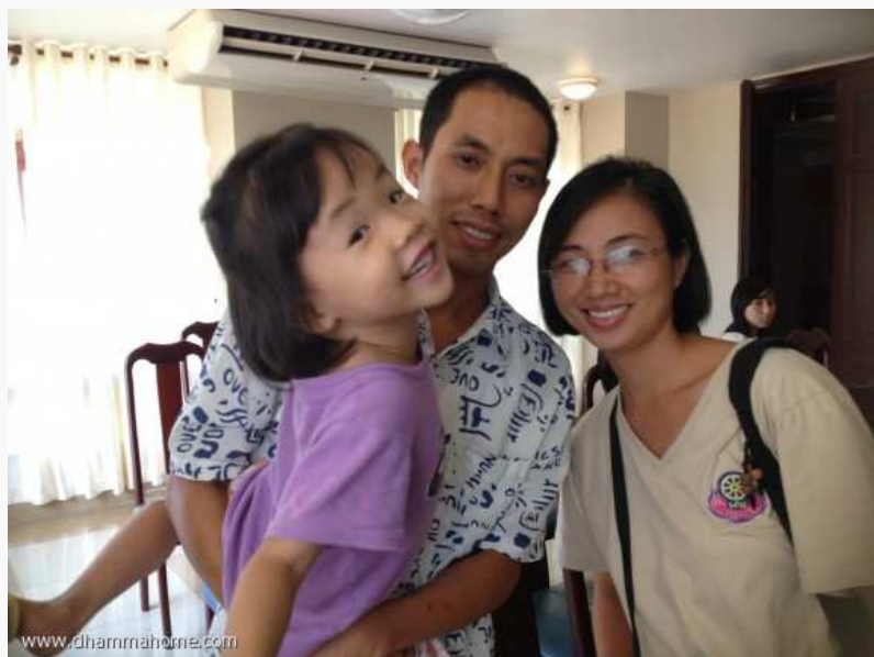
ครอบครัวมหัศจรรย์ที่สนใจธรรมะทั้งพ่อ แม่ ลูก