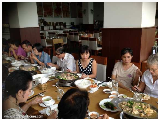
(คุณฮว่า เจ้าภาพใส่เสื้อลายจุด)