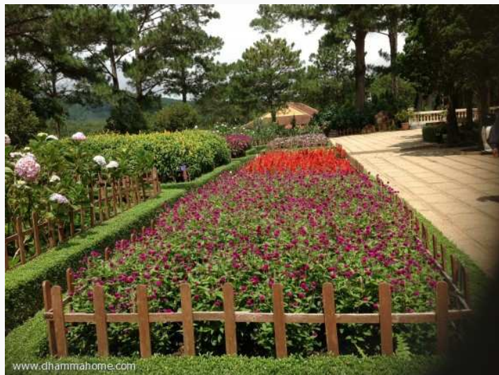
(สวนสวยในวัดบนาเขา)