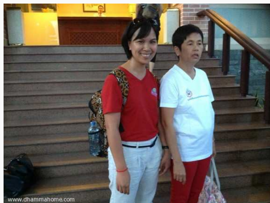
(แดง - ชาว ไทย - เวียดนาม)