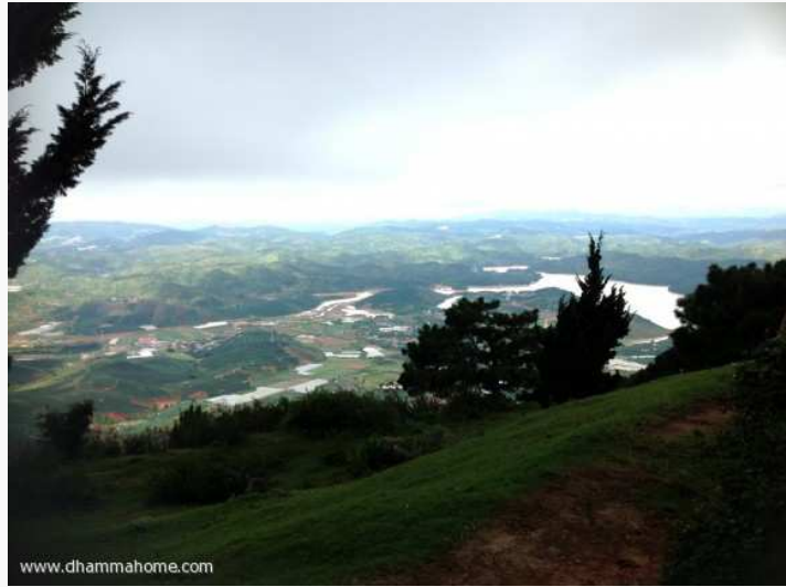
(แม่น้ำทองคำ มองจากภูเขาสีเขียว)