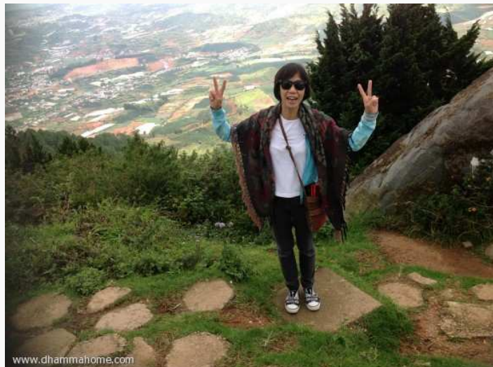
(ทิวทัศน์เมืองดาลัด มองจากภูเขาสีเขียวเบียง)