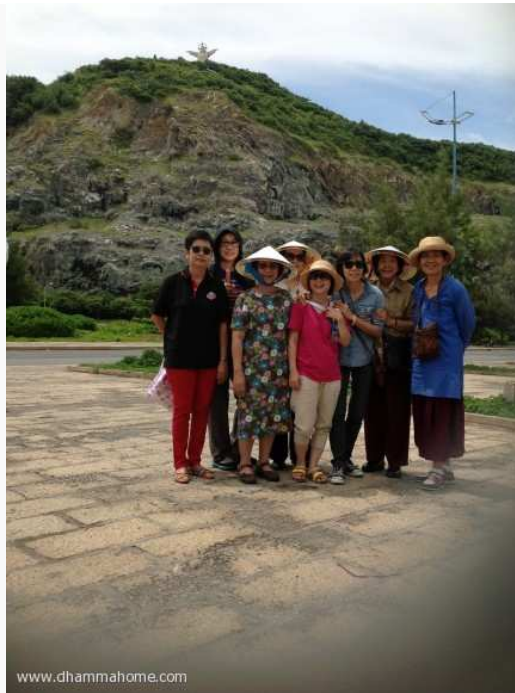
(ทิวทัศน์รอบเมือง)