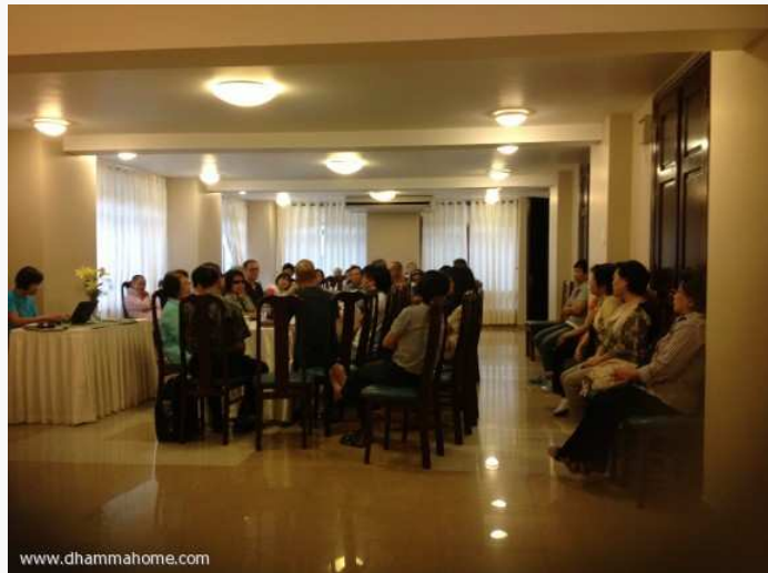
(การสนทนาธรรมวันสุดท้ายที่หุงเต่า)

ขณะแต่ละขณะเกิดดับผ่านไป จนมาถึงวันนี้ ซึ่งเป็นวันสุดท้ายของการเผยแผ่พระธรรมของท่านอาจารย์ ที่เวียตนามได้ จากไซ่ง่อนมาถึงหุงเต่า