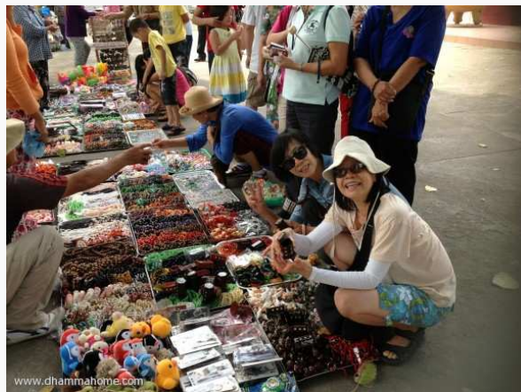
(ซื้อของฝาก)