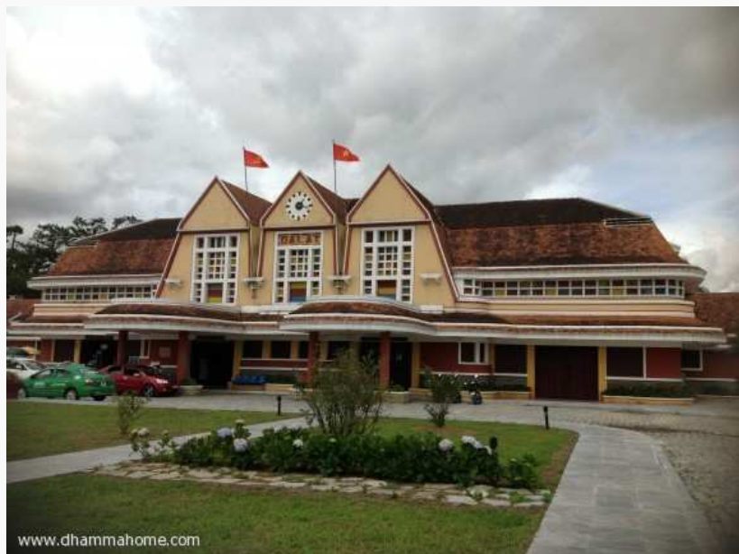
(สถานีรถไฟ สมัยฝรั่งเศส)

คราวนี้จบแล้วจริงๆ อะ หวังว่าคงพบกันใหม่ที่เวียดนามกลางปีหน้าละ