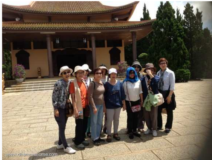
(วัดบนาเขา)