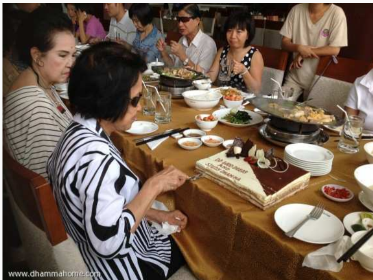
(ท่านอาจารย์ตัดเค้ก)