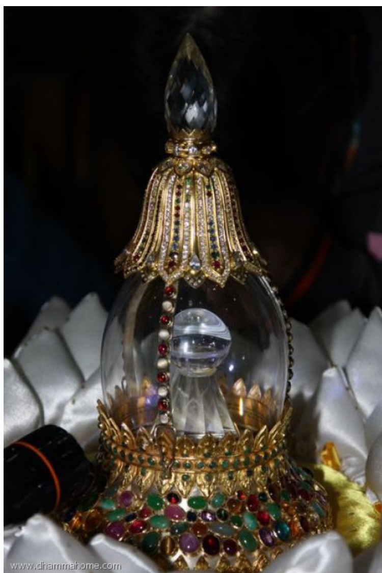
พระบรมสารีริกธาตุ

พระสูตรตันตปิฎก ขุททกนิกาย เถรีคาถา เล่ม ๒ ภาค ๔ หน้า ๑๑๑ [โสมมาเถรีคาถา]