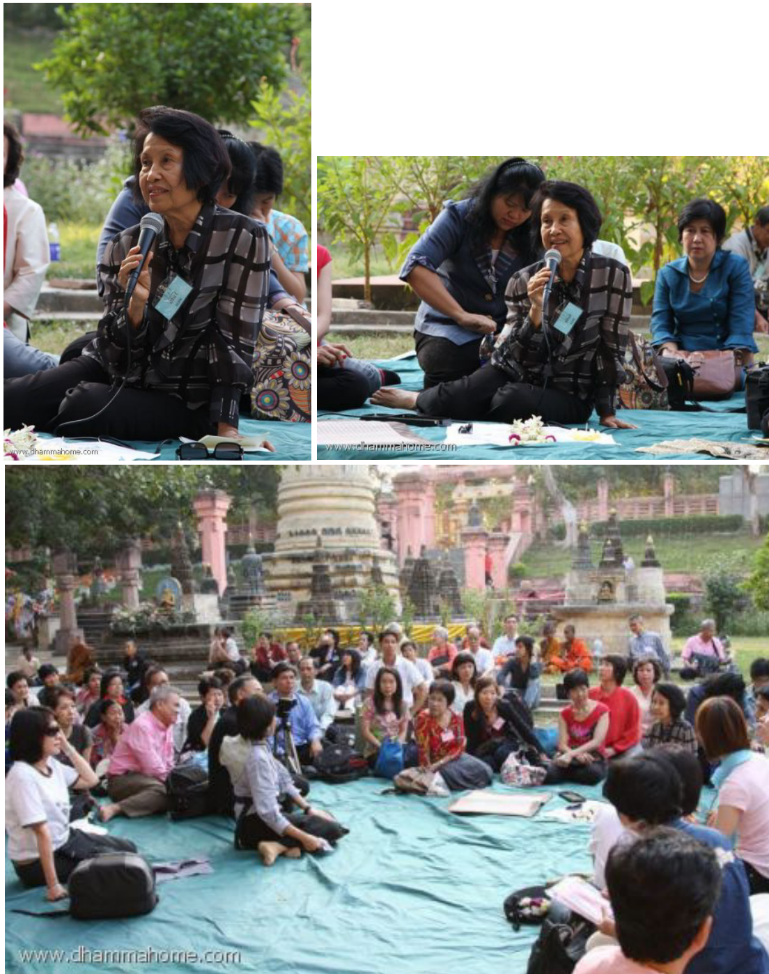
ท่านอาจารย์สนทนารธรรม ภายใต้ต้นพระศรีมหาโพธิ์ พุทธคยา