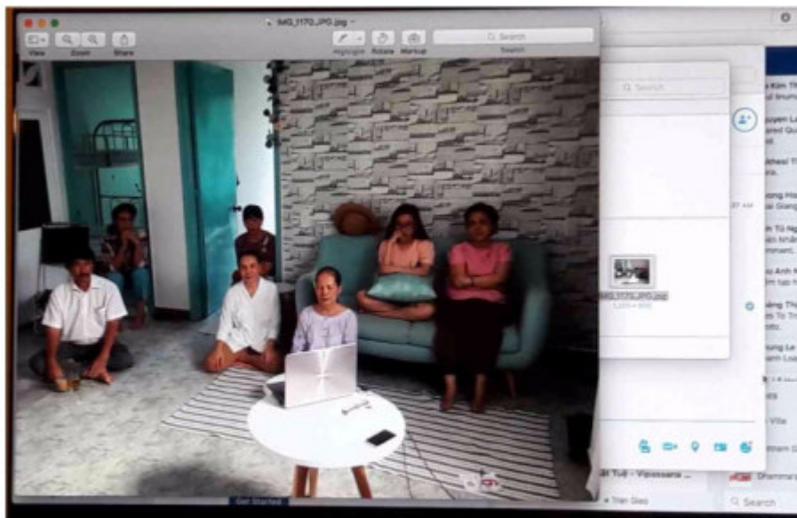
ภาพผู้ชมการถ่ายทอดสดการสนทนาธรรมทาง Youtube จากเมือง Nha Trang